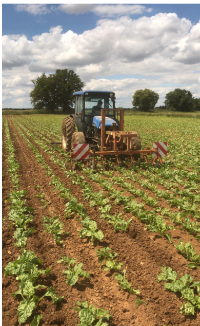
Binage betterave - le 12/06/24 St Hilaire de Gondilly (18)

Malgré des pousses encore satisfaisantes, les situations sont parfois tendues pour certains lots au pâturage. Dans certaines exploitations, les premières coupes ont débuté récemment, posant des difficultés pour l'agrandissement de la surface à pâturer. En plus de cela, il faut aussi noter la présence d'herbe épiée peu appétente liée à une date de mise à l'herbe tardive. Pour permettre un retour rapide des dernières parcelles encore non fauchées dans le circuit de pâturage et allonger au maximum la durée de pâturage, il faut viser une hauteur de fauche de 10 cm.