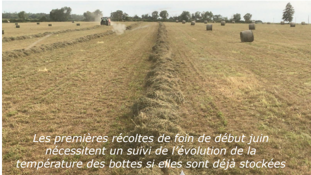
Les premières récoltes de foin de début juin nécessitent un suivi de l'évolution de la température des bottes si elles sont déjà stockées